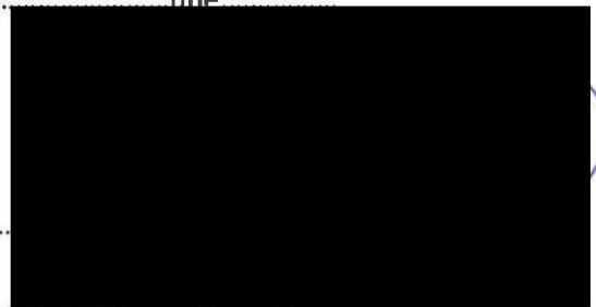
LASTAV 72, spol. s r. o.

LASTAV 72 spol. s r. o. Sokolovská 194/400 180 00 Praha 8 IČ: 26202239, DIČ: CZ26202239