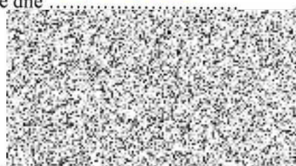
OBJEDNATEL Martin Draxler, radní pro oblast regionálního rozvoje, cestovního ruchu a sportu