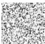
DODAVATEL Atelier T-plan, s.r.o. RNDr. Libor Krajiček, jednatel