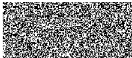
předseda představenstva ČEPRO, a. s.