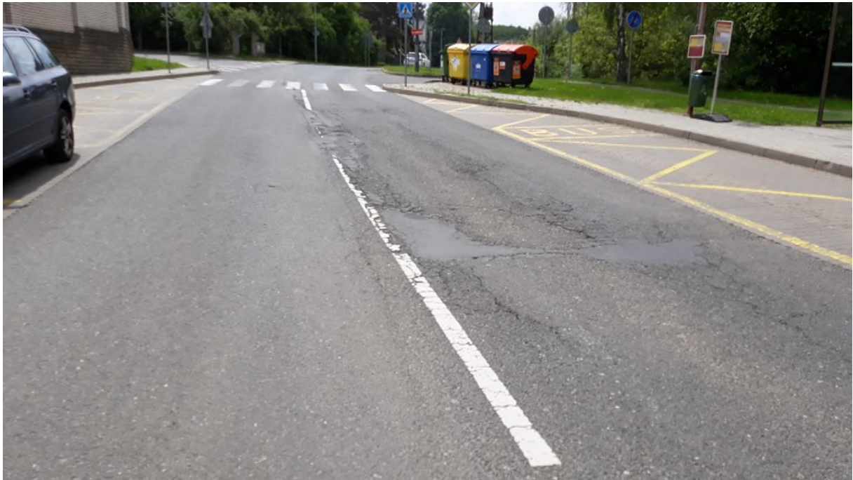
Zpracoval Karel Motal v červnu 2020