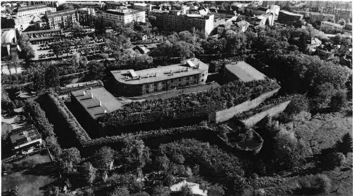
Čtyři linie obrany s objektem reduitu /budova XQ/, který slouží jako archiv Fakultní nemocnice Olomouc.