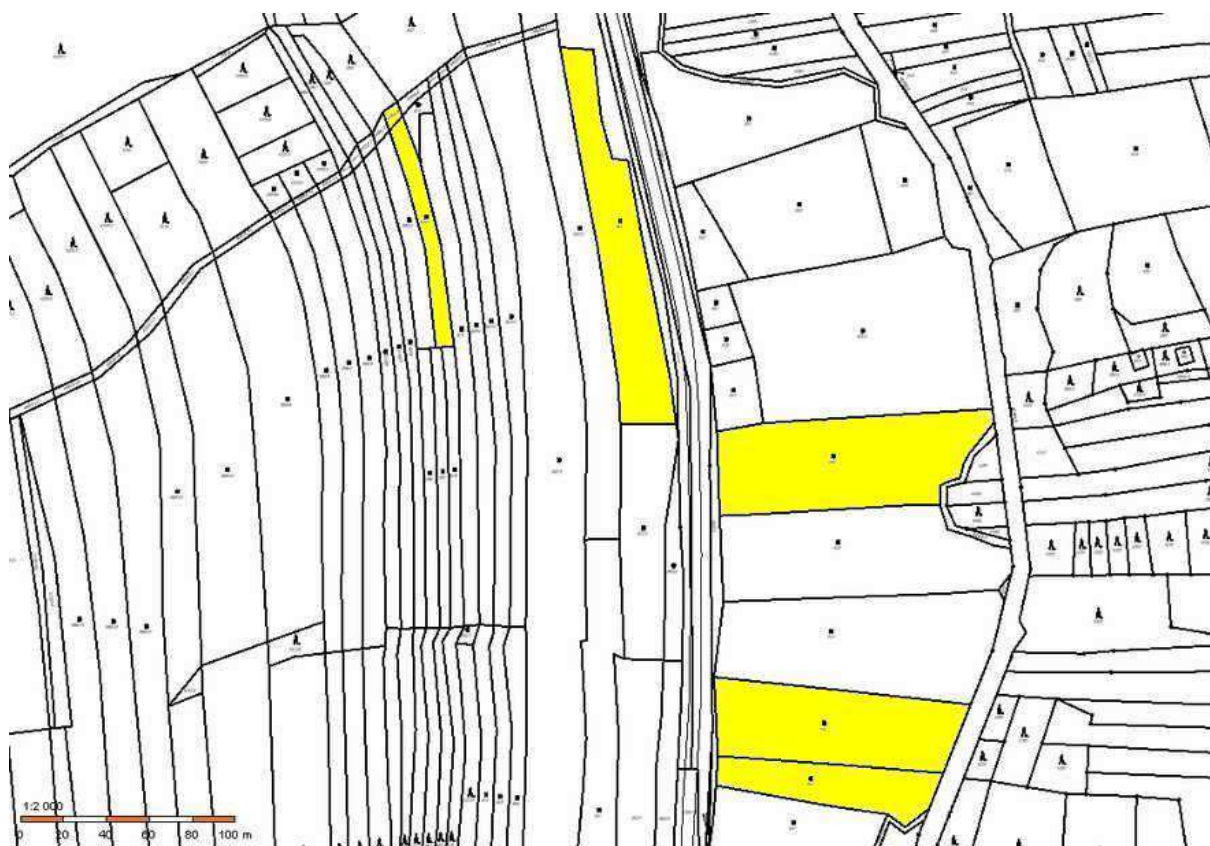
Žlutě k. ú. Vysoké Pole (p. č. 4464/9, 999/1, 954, 942, 945 a 946)