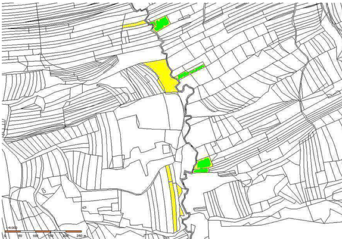
Zeleně k. ú. Vysoké Pole (p. č. 2155, 2156, 2070, 2071, 1950 a 1951); Žlutě k. ú. Újezd u Val. Klobouk (p. č. 3986/26, 3986/7, 4127/38, 4132/1, 4127/1, 4333 a 4334)