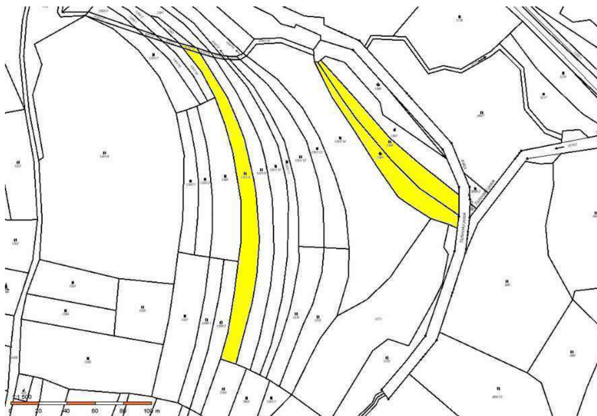
Žlutě k. ú. Vysoké Pole (p. č. 4397/4, 1391/8, 1368 a 1369)