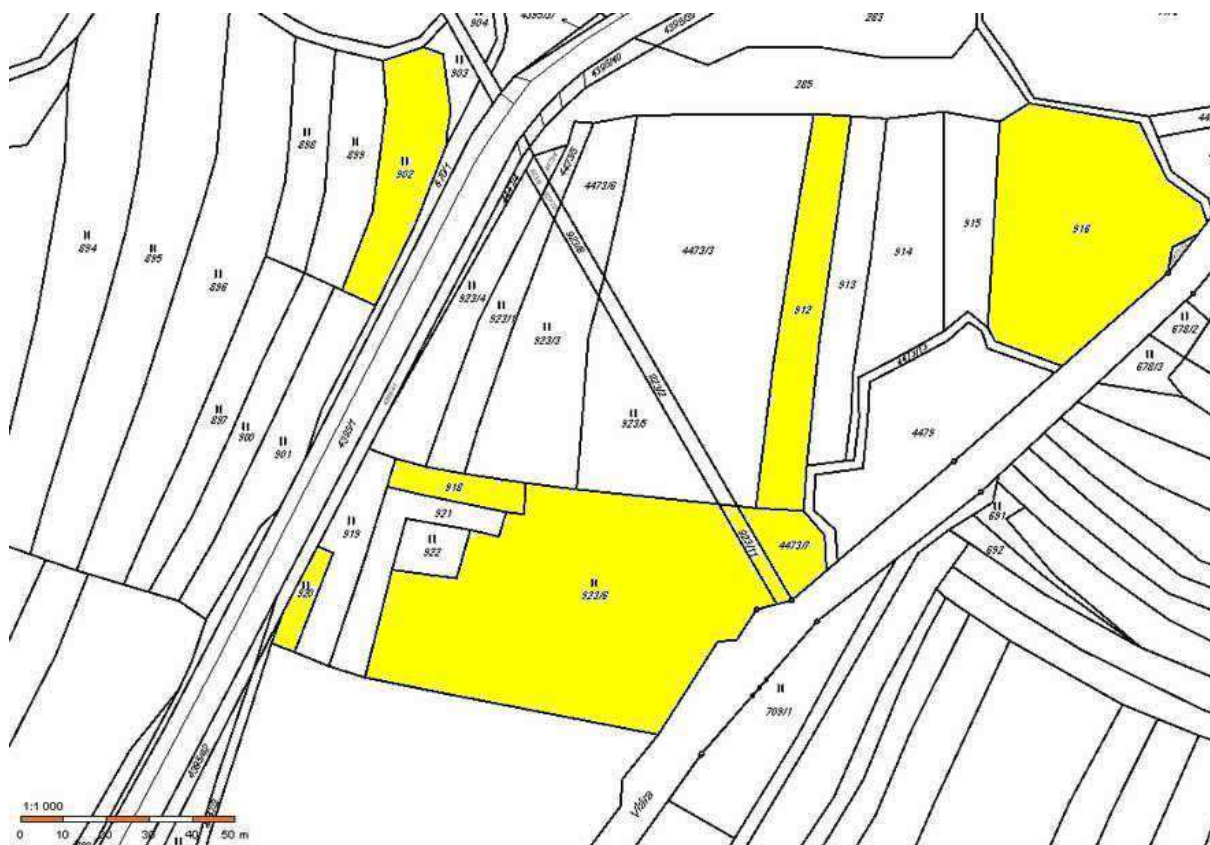
Žlutě k.ú. Vysoké Pole (p. č. 902, 918, 920, 923/6, 923/11, 4473/7, 912 a 916)