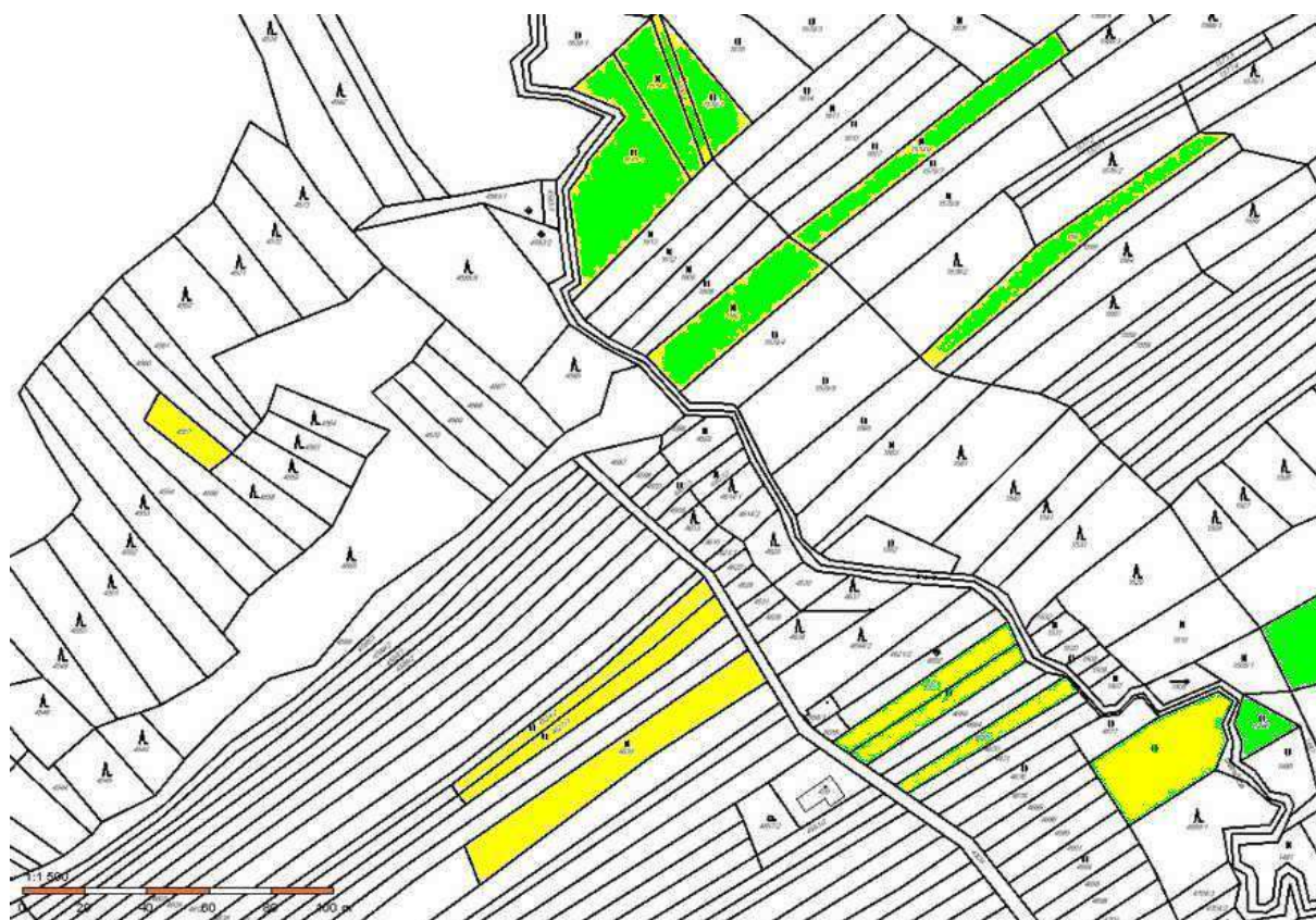
Zeleně k. ú. Vysoké Pole (p. č. 1615/1, 1579/1, 4400/8, 1579/2, 1582, 1579/6, 1567, 1486 a 1505/2); Žlutě k. ú. Újezd u Val. Klobouk (p. č. 4557, 4624/2, 4627/3, 4639, 4653, 4658, 4665 a 4690)