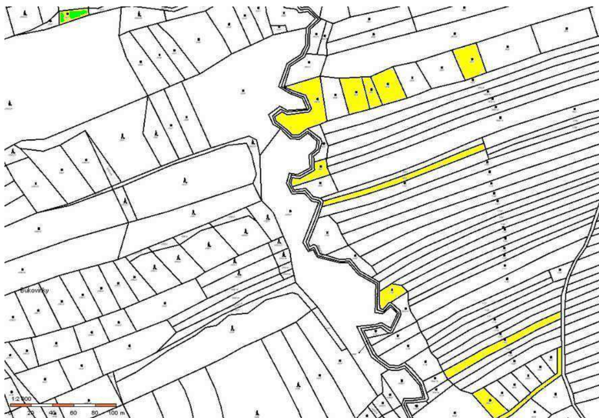
Žlutě k. ú. Vysoké Pole (p. č. 1840/2, 1833, 1836, 1837, 1838, 1812, 1803, 1755, 1702, 1806/17 a 1677/2); Zeleně k. ú. Újezd u Val. Klobouk (p. č. 4307)