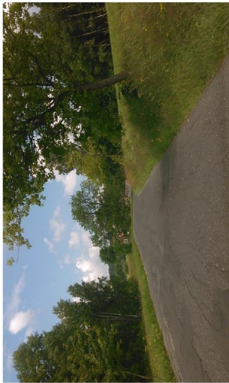
Silnice III/29036 a III/29037 Horní Maxov – Horní Lučany, rekonstrukce silnice