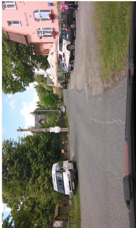
Silnice III/29036 a III/29037 Horní Maxov – Horní Lučany, rekonstrukce silnice