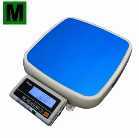
TSCALE FOX-II, 150;250KG/50;100G, 355X370MM, LAK-HLINÍK