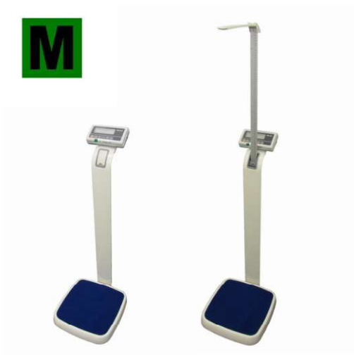
TSCALE FOX II-LOV, 150;250KG/50;100G, 355X370MM