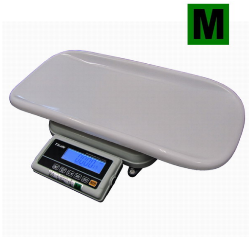
TSCALE FOX-I-BABY, 6;15KG/2;5G, 600X280MM