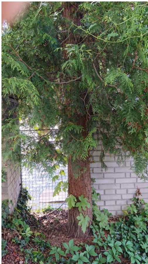
Exemplář hodnocený pod číslem 36. Thuja occidentalis - silně prosychající koruna