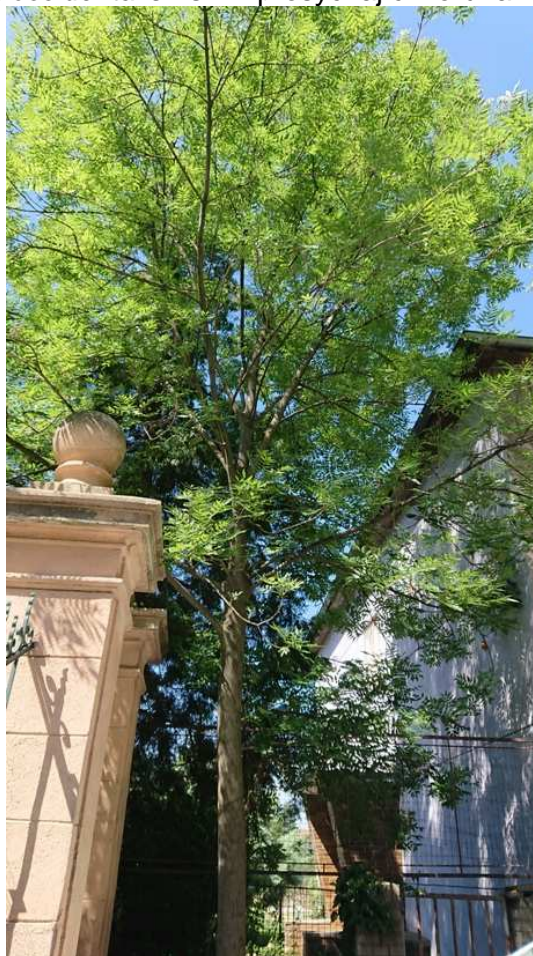
Exemplář hodnocený pod číslem 37. Fraxinus excelsior - není nutné udělení povolení ke kácení dřevin