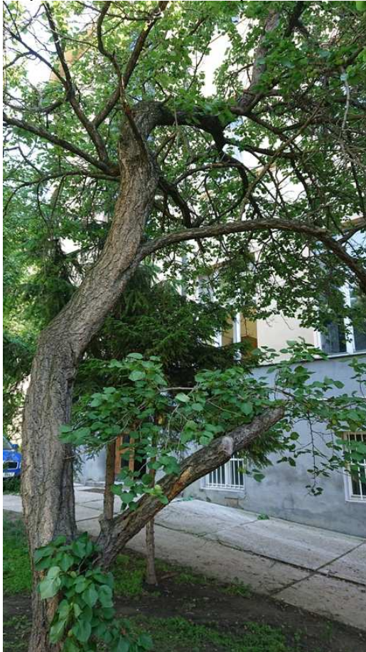
Exemplář hodnocený pod číslem 41. Prunus armeniaca L.