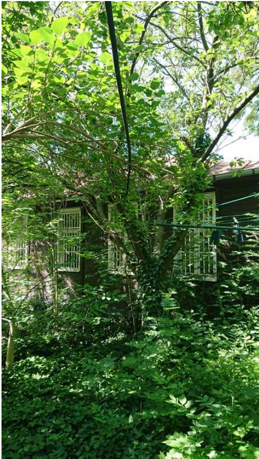
Exemplář hodnocený pod číslem 42. Prunus serrulata 'Kanzan'