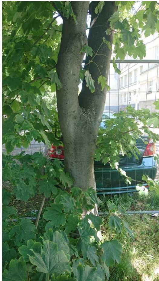
Exemplář hodnocený pod číslem 49. Acer pseudoplatanus , podúrovňový neperspektivní exemplář