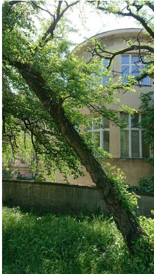
Exemplář hodnocený pod číslem 48. Robinia pseudoacacia , silně vykloněný, usychající exemplář, havarijní stav