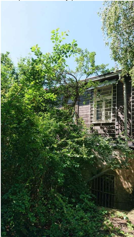
Exemplář hodnocený pod číslem 39. Prunus domestica - torzo exempláře zarostlé v kořenových výmladcích stromu