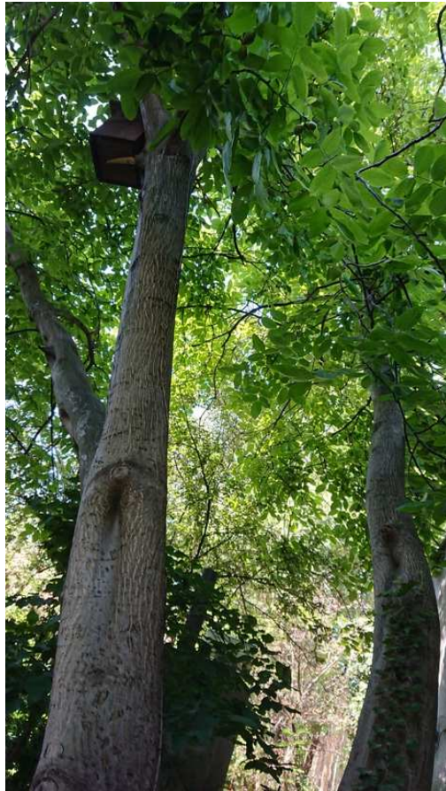
Exemplář hodnocený pod číslem 43. Juglans regia