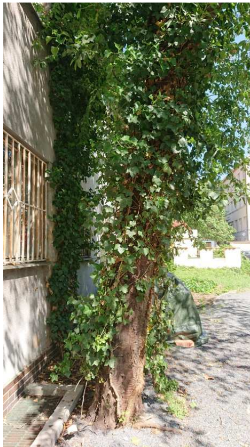
Exemplář hodnocený pod číslem 38. Prunus avium rostoucí v bezprostřední blízkosti budovy