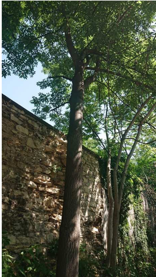
Exemplář hodnocený pod číslem 44. Ailanthus altissima