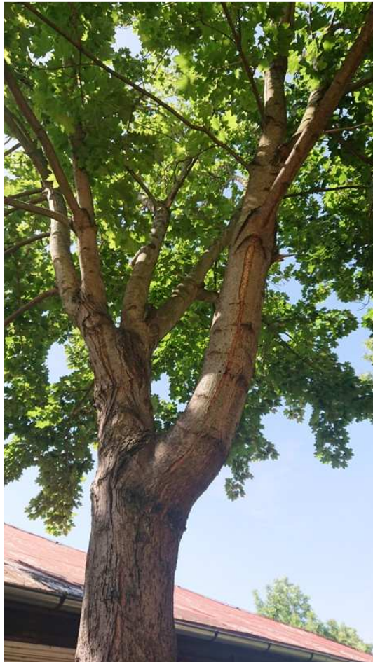
Exemplář hodnocený pod číslem 45. Acer platanoides , vyčnívající kořeny, nevhodné větvení v koruně