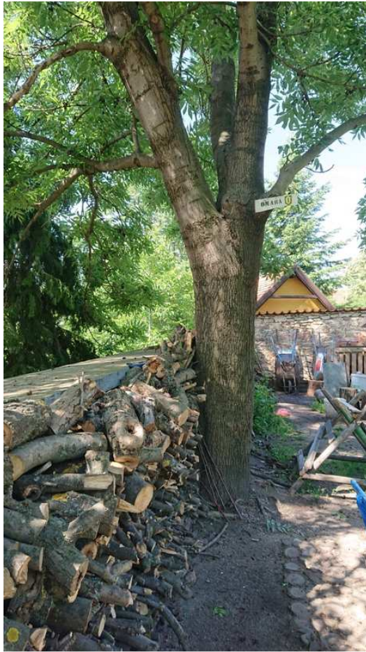
Exemplář hodnocený pod číslem 46. Fraxinus excelsior rostoucí na koruně opěrné zdi v její bezprostřední blízkosti