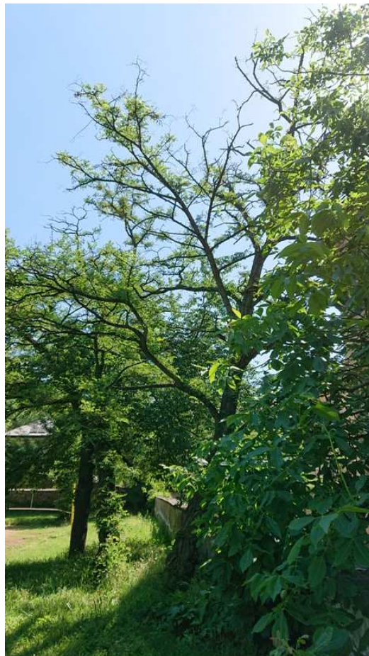
Exemplář hodnocený pod číslem 47. Robinia pseudoacacia , usychající exemplář vykloněný nad zdí - havarijní stav