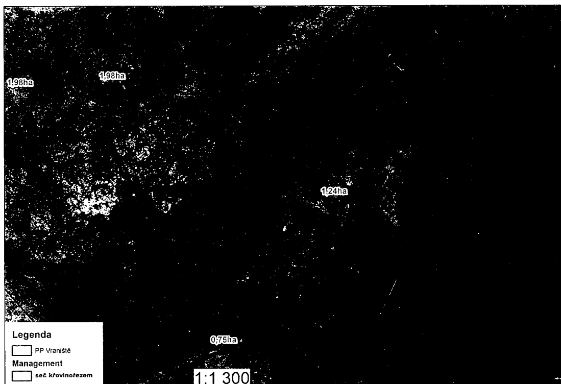
Vraniště - seč křovinořezem V