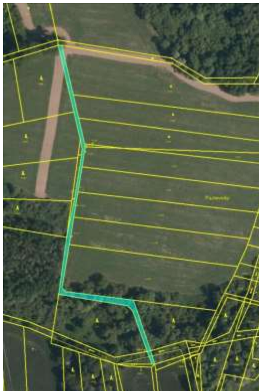
parc. č. 411/1, parc. č. 399/35, k. ú. Zámrsky