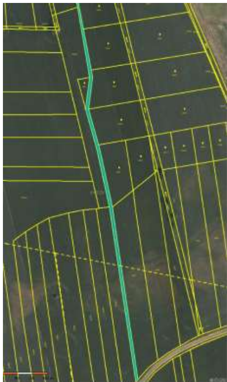
parc. č. 391, k. ú. Zámrsky