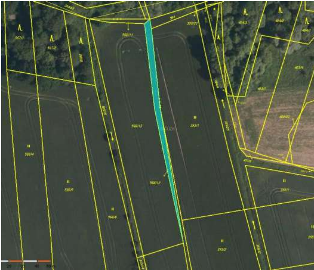
parc. č. 568/12, k. ú. Skalička u Hranic