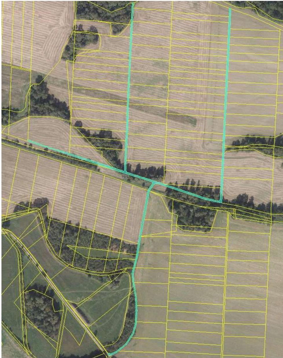
parc. č. 506, parc. č. 522, parc. č. 527/11, parc. č. 529/4, parc. č. 533/3, vše k. ú. Zámrsky