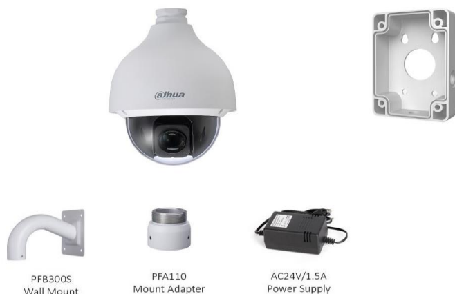
PFB300S Wall Mount