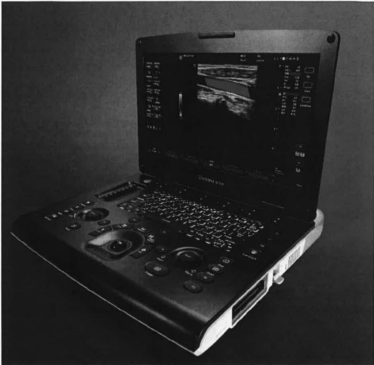
Obr. č. 1: Konzole mobilního systému Versana Active