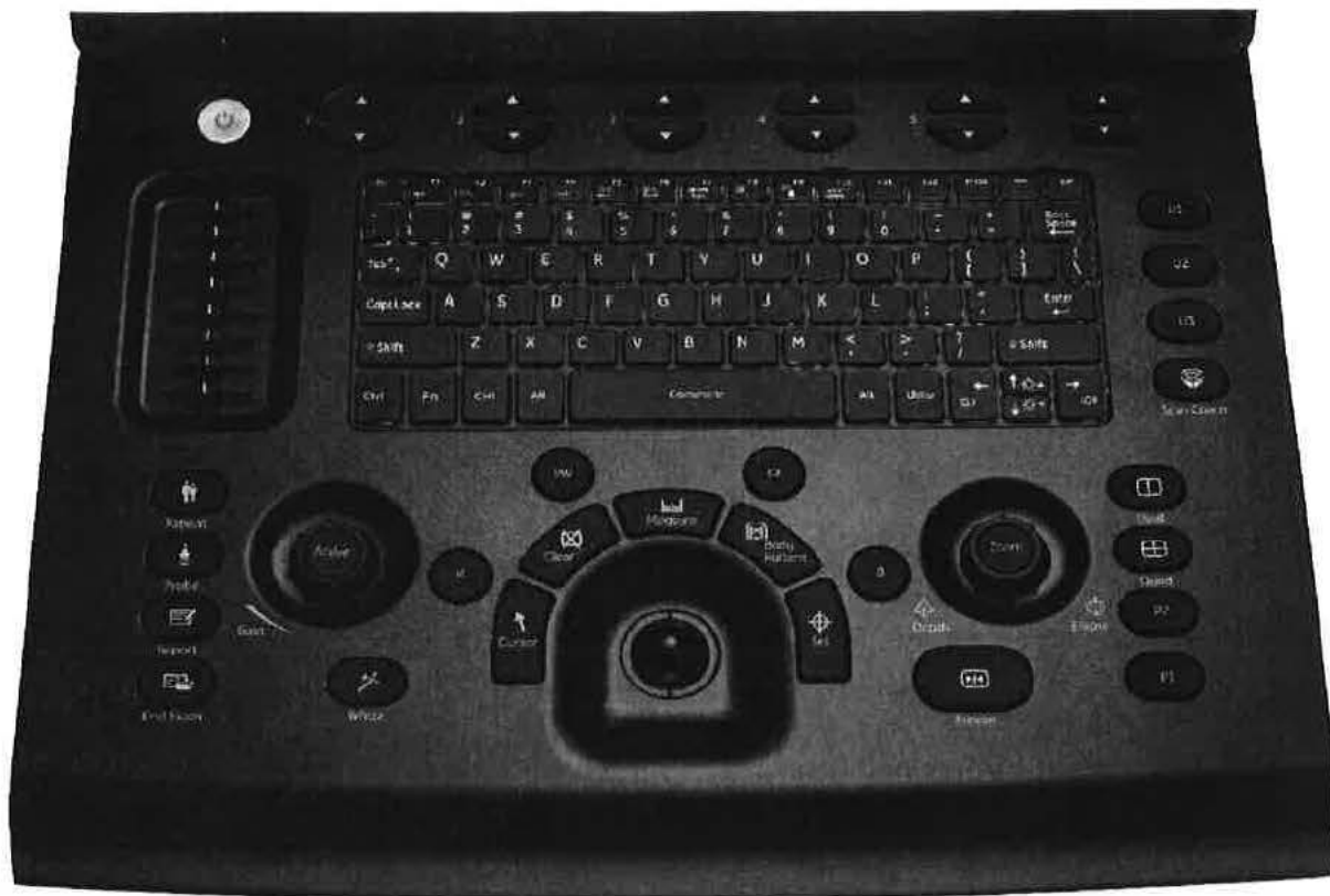
Obr. č. 2: Detail ovládacího panelu a funkce Whizz (kontinuální automatická optimalizace)