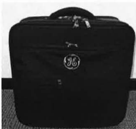
Obr. č. 4: Mobilní převozní pouzdro pro přístroj, příslušenství a sondy