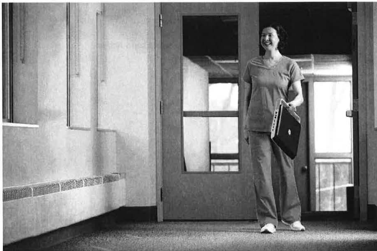
Obr. č. 3: Integrované madlo pro bezpečný transport systému Versana Active