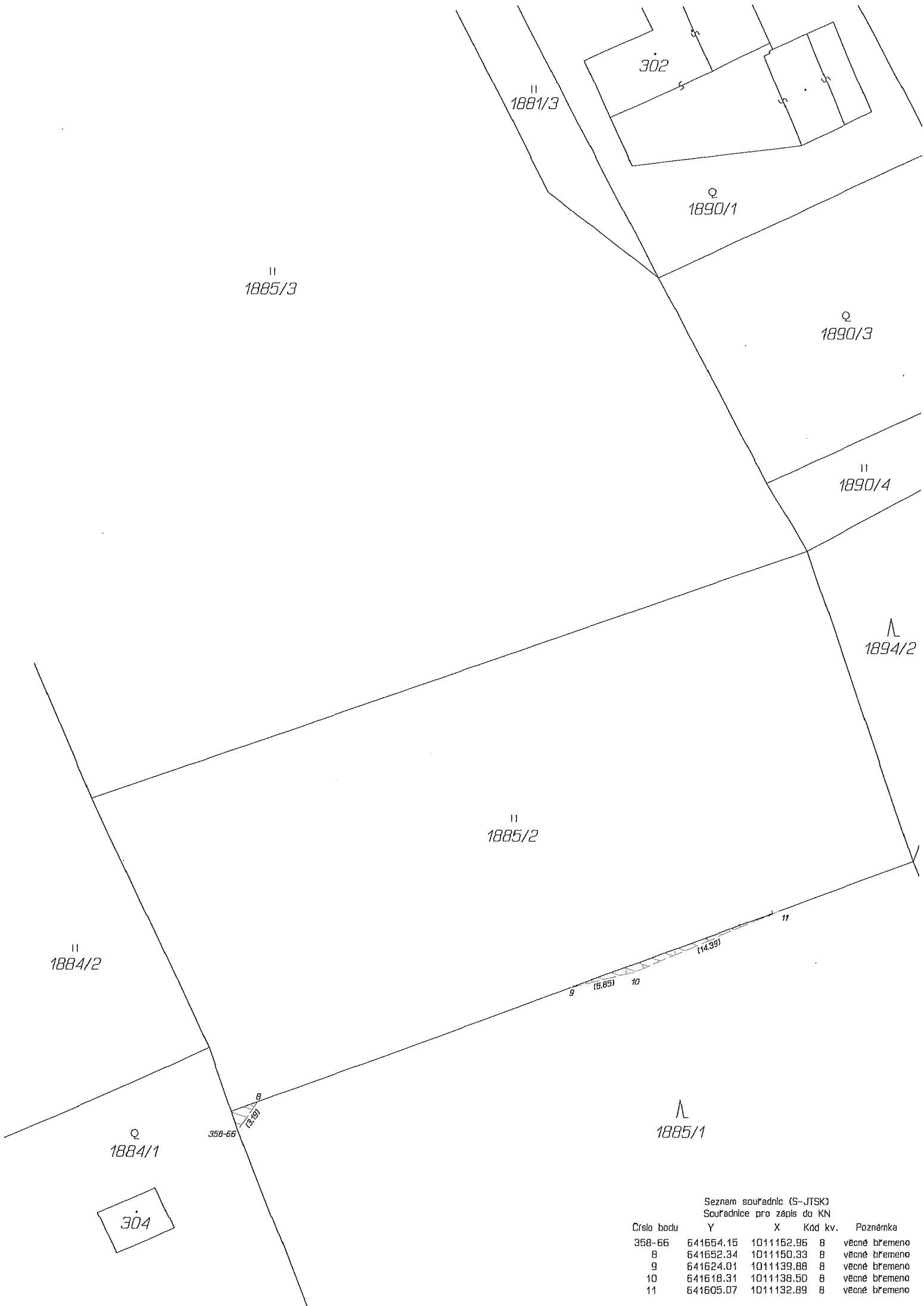
Seznam souřadnic (S-JTSK) Souřadnice pro zápis do KN