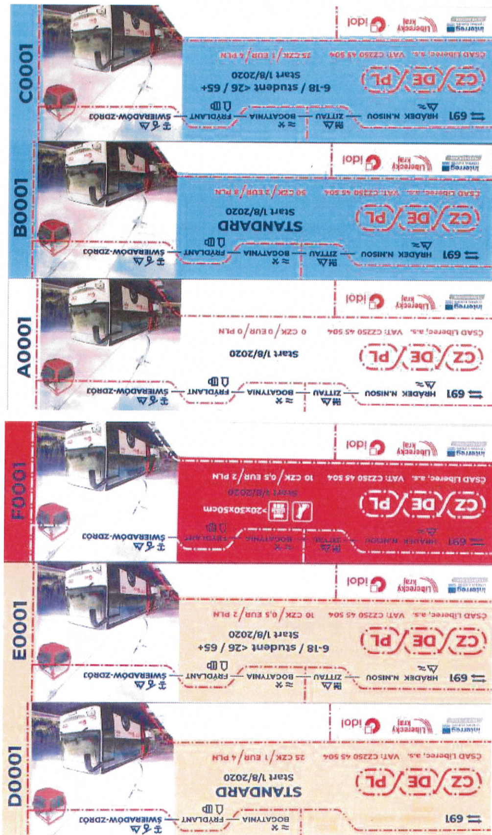
PO2: Vzory jízdních dokladů na lince 691