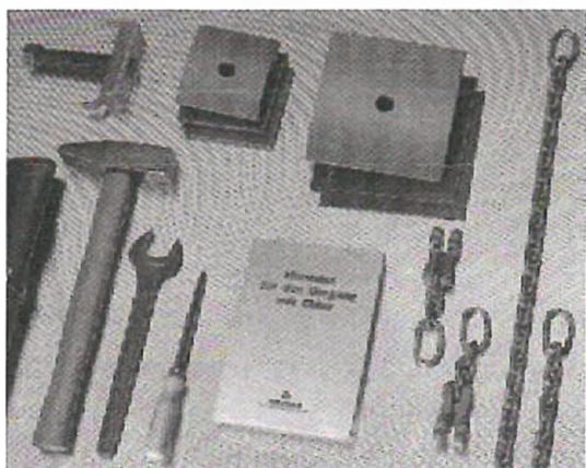
Obr. č.5 Bezpečnostní sada při netěsnosti povrchu těla chlorové tlakové nádoby dodávaná společností GHC Invest k bezpečnému zajištění netěsného povrchu chlorové lahve nebo sudu Objednací číslo sady pro netěsnost lahve : 21881 Objednací číslo sady pro netěsnost sudu : 21882