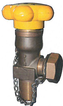
Obr. č.6 Chlorový ventil dodávaný společností GHC Invest s našroubovanou bezpečnostní těsnicí maticí na přípojovacím závitě ventilu

Na přípojovacím závitě každého ventilu musí být našroubovaná a utažená závěrná, bezpečnostní těsnicí matice.