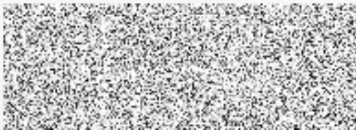
poskytovatel razítko a podpis zástupce