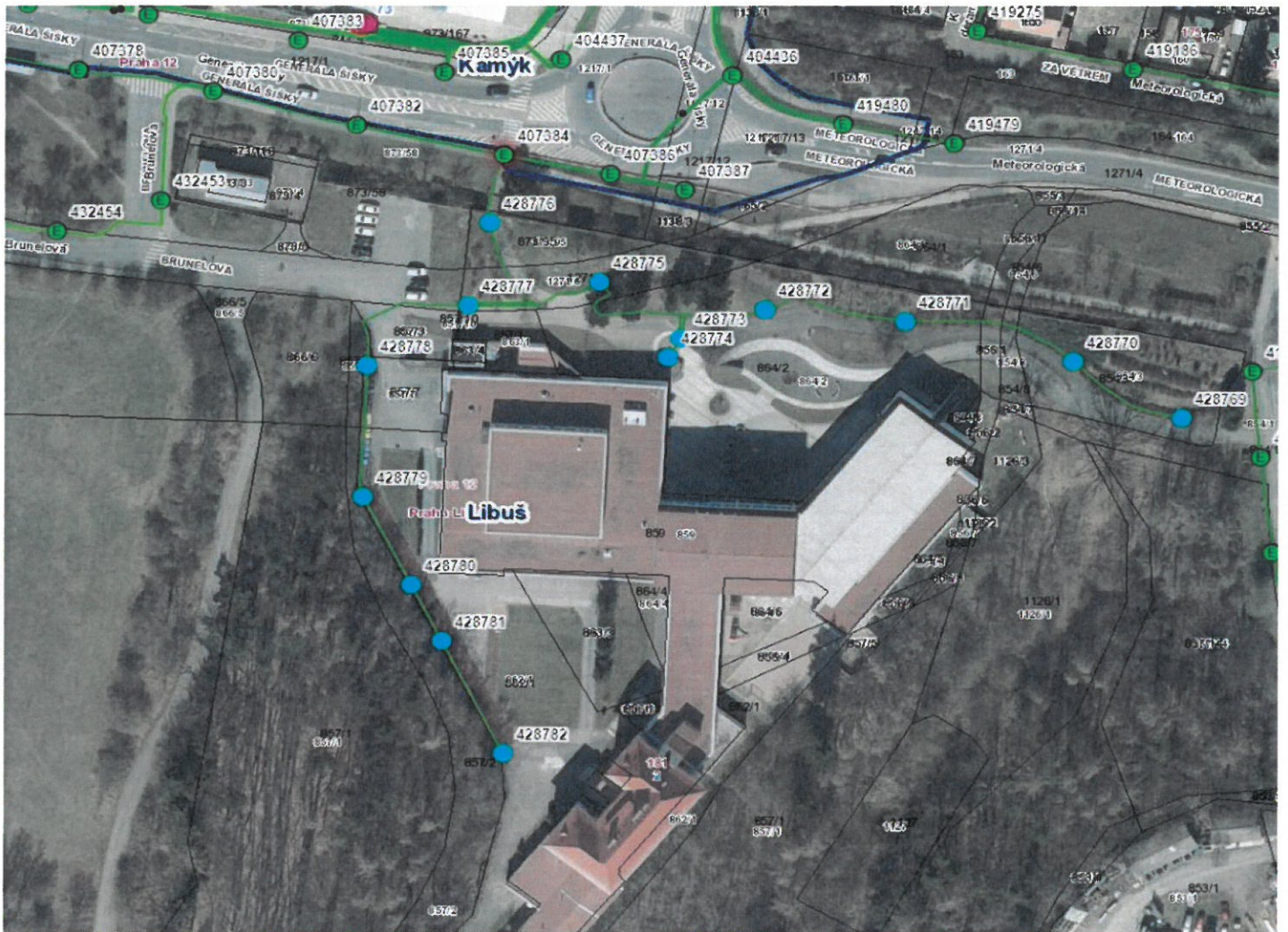
Mapa se zákresem dotčených světelných míst, lokalita MČ Praha 12 - Libuš, areál ZŠ Meteorologická