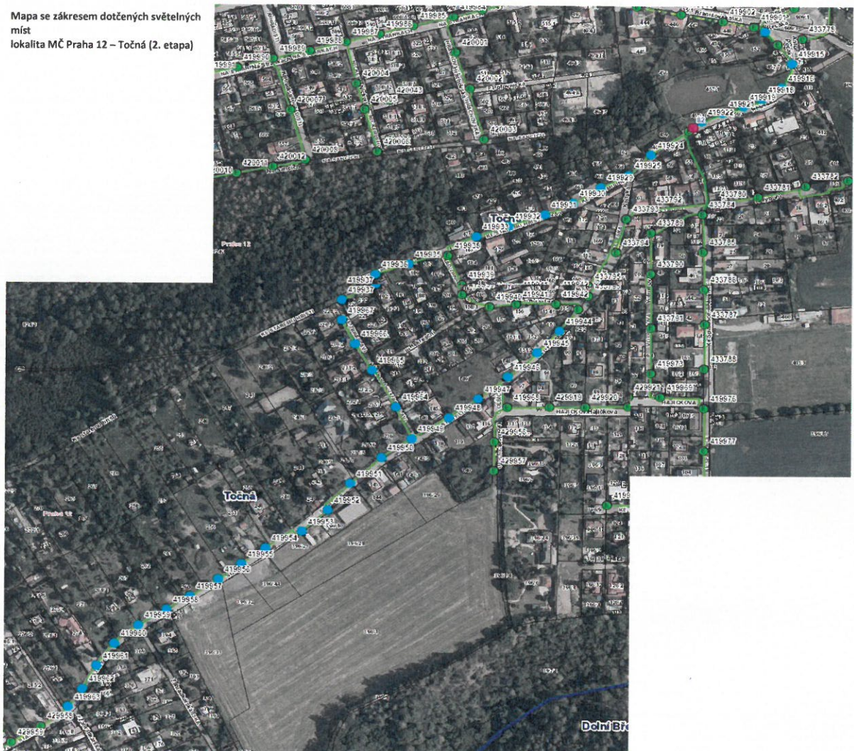
Mapa se zákresem dotčených světelných míst lokality MČ Praha 12 – Točná (2. etapa)