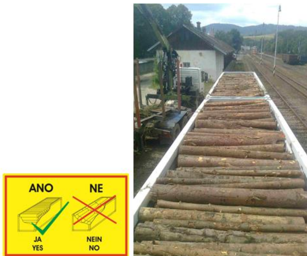
Obrázek 2: Ložení kulatiny 2m do vozů s kontejnerovou nástavbou (AgroTainer)

K zajištění nákladu může být použito pouze upevňovacích pásů určených pro železniční přepravu. Upevnění drátem nebo jakékoliv provázání (např. klanic) není dovoleno u všech typů vagónů. V případě použití pásů pro zajištění nákladu je dodavatel povinen uvádět počet pásů na vagóně na původních dokladech zásilky (železniční nákladní list). Bez uvedení počtu pásů nebude možno, nárokovat jejich uhrazení při ztrátě.