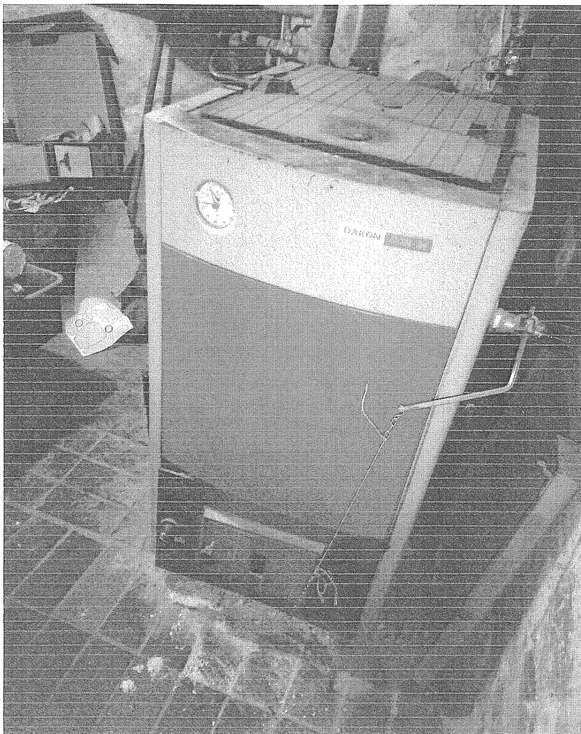
PRIBYSLAVICE, Hled' nuda' 19