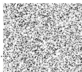
předseda Odborové sdružení základních organizací Dopravního podniku Autobusy Praha