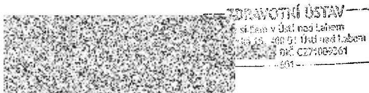
razítko a podpis pojistníka