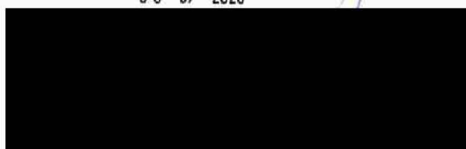
SPORTOVNÍ KLUB BASKETBALU ZLÍN, z.s.