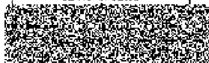
plk. Ing. František Mencel ředitel

Česká republika Hasičský záchranný sbor Královéhradeckého kraje nábřeží U Přívozu 122/4 500 03 Hradec Králové IČ: 70 88 25 25 CZ-NUTS: CZ0521