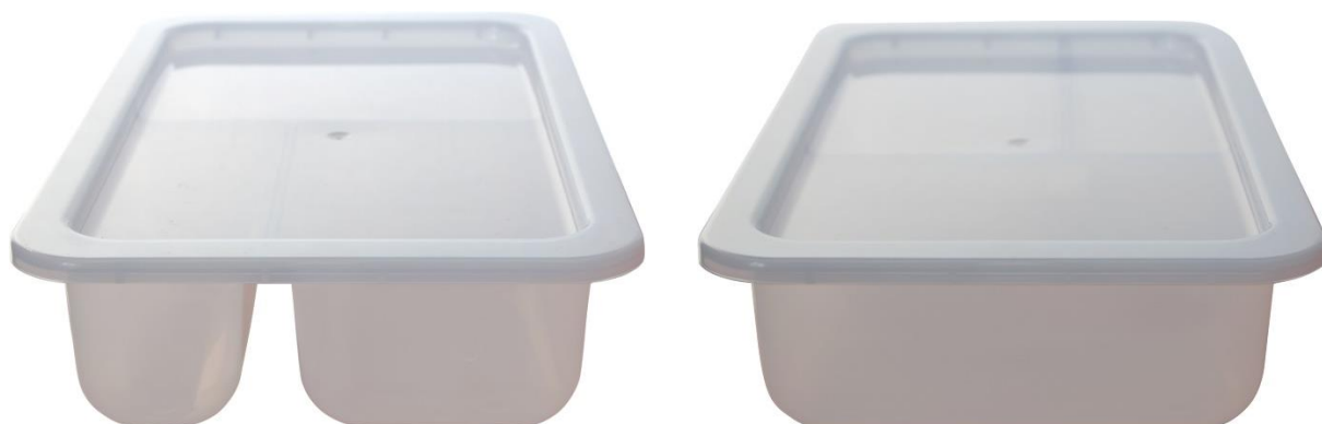
vrchní a čelní pohled z obou stran

Fotografie jsou pouze pro vizualizaci, neodpovídají požadovanému barevnému provedení.