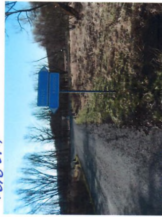
FOTO c. 3