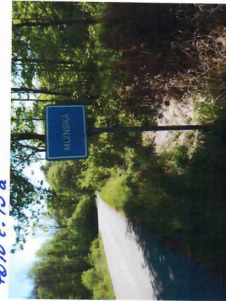
FOTO č. 10