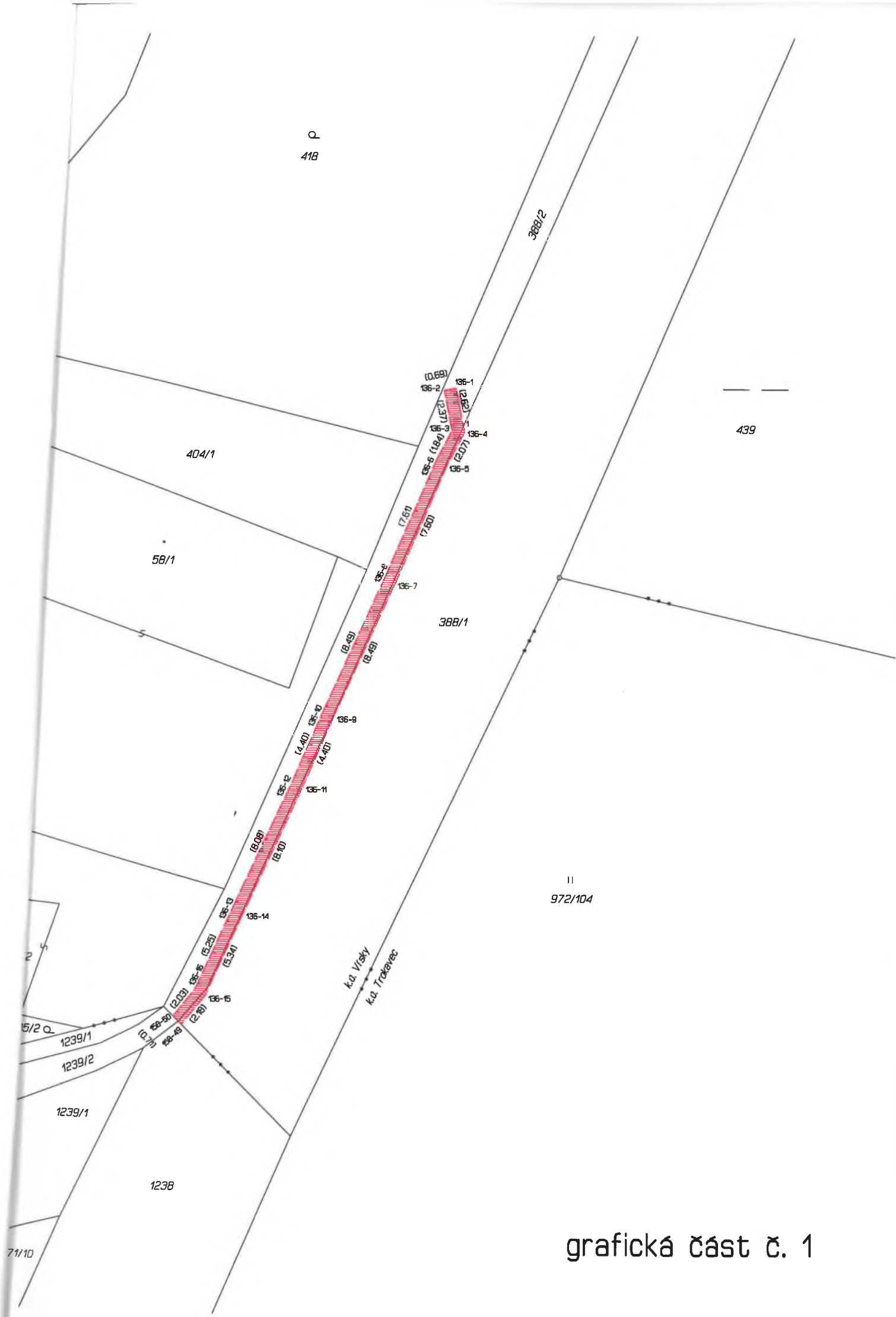
grafická část č. 1