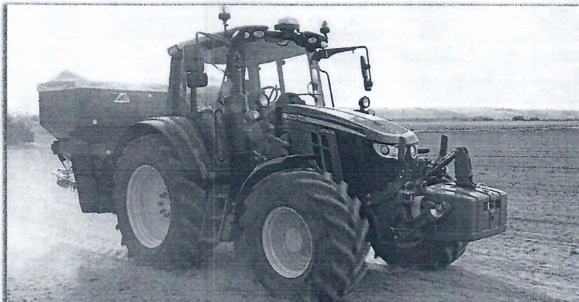
Obrázek 1: ilustrativní foto