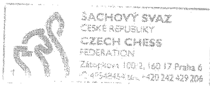
František Štross generální sekretář ŠSČR

Během extraligy hrály jednotlivé týmy své zápasy proti soupeřům v hracích místnostech domácích týmů, přičemž vždy vše zajišťoval domácí oddíl. Při Mistrovství ČR družstev mládeže hrají všechny týmy všechny zápasy na jednom místě, přičemž vše zajišťuje pořadatel mistrovství. Kromě jiného pořadatel zajišťuje on-line přenos partií i veškerý materiál a personál pro všechny zápasy.