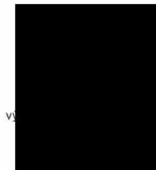
vyřizovatelka kce rování