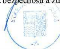
razítko Středočeského kraje