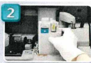
2. vložení adaptéru se vzorkem