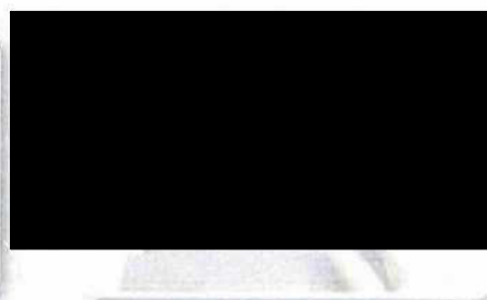
3. stisknutí tlačítka START