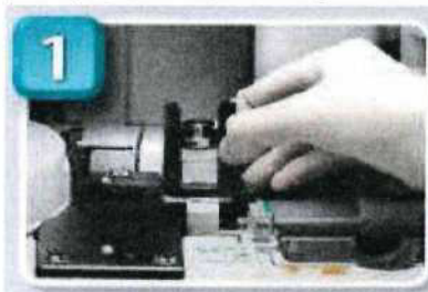
1. vložení slidů (až 20 ks slidů na jeden vzorek)

Postup analýzy (k analýze stačí pouze tři následující kroky):