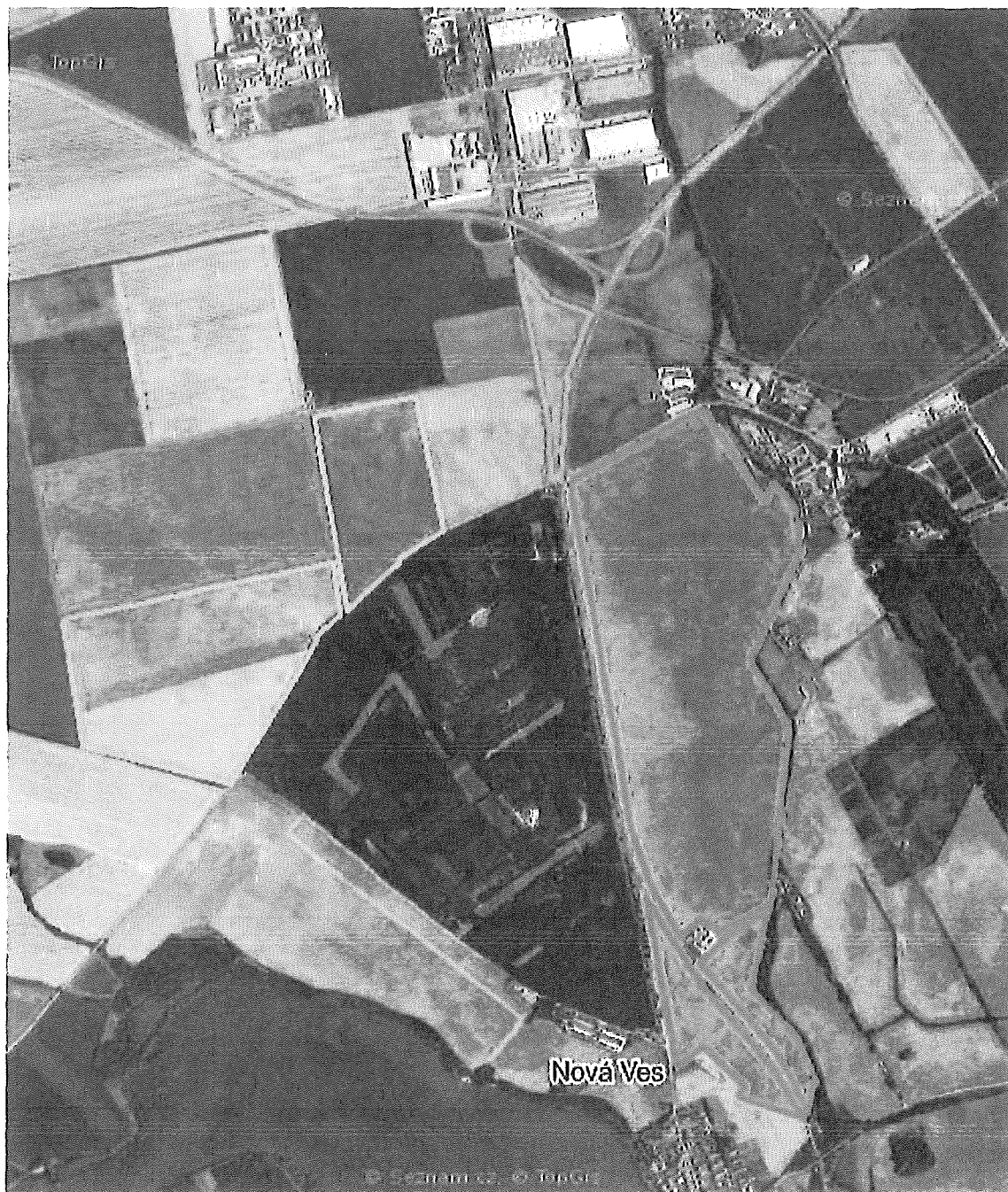
Obr.1 - k.ú. Pohořelice n.J

Vysvětlivky: červená barva – pšenice ozimá, zelená barva – ječmen ozimý, modrá barva – oves setý, žlutá barva – kukuřice