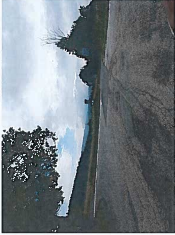
Silnice III/28624 Mrklov, rekonstrukce silnice