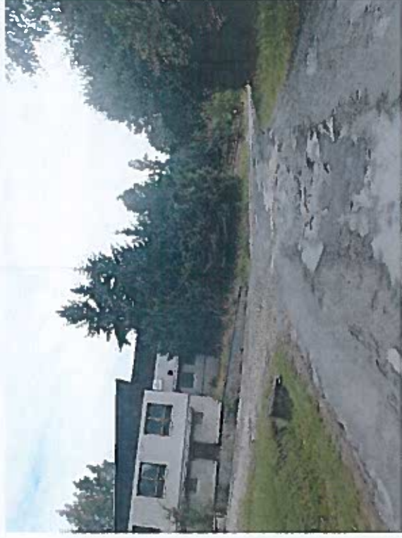
Silnice III/28624 Mrklov, rekonstrukce silnice