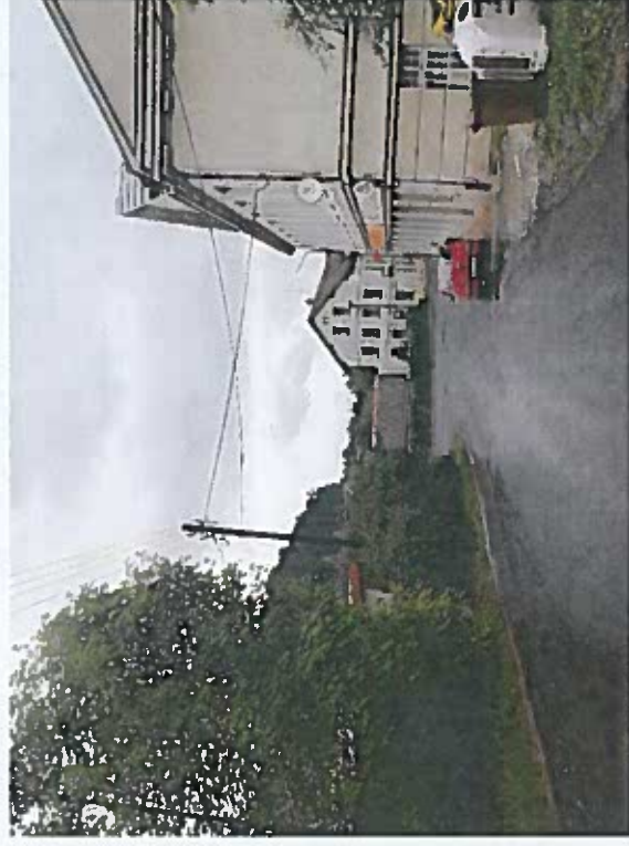
Silnice III/2886 Návarov - Jesenný, rekonstrukce silnice