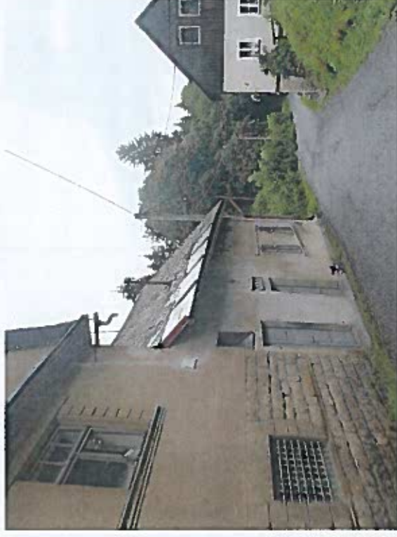
Silnice III/2886 Návarov - Jesenný, rekonstrukce silnice