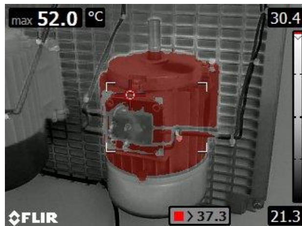
Funkce izoterma s funkcí Blending