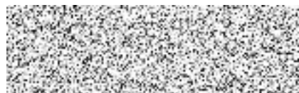
G4S Secure Solutions (CZ), a.s. předseda představenstva