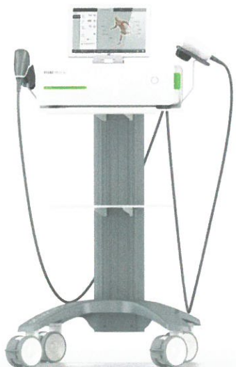
MASTERPULS MP100 Ultra