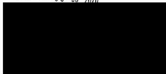
Golf Club Lázně Kostelec u Zlína, spolek