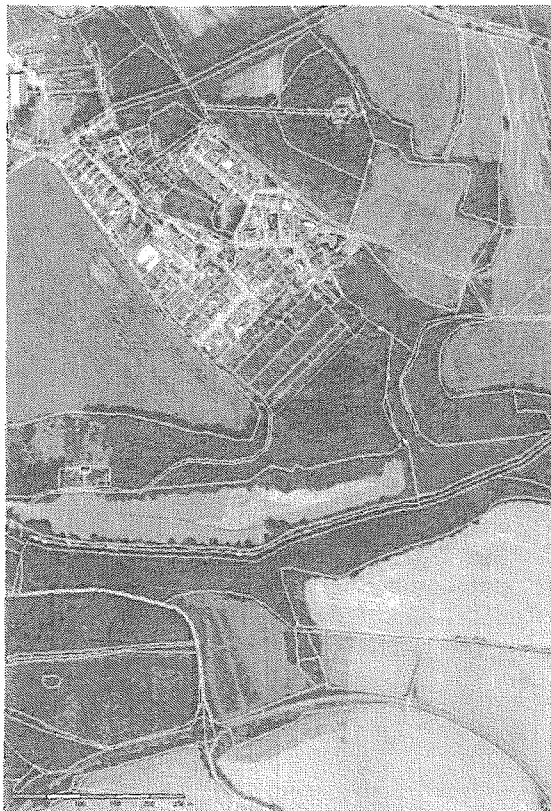
Obec Plandry (okr. Jihlava)

Objednatel: Obec Plandry Plandry 30 588 41 Vyskytná nad Jihlavou