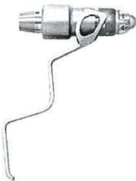
Frézovací nástavec (530.780) krouťací moment