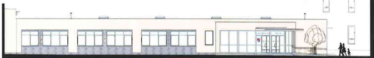
POHLED OD JIHU