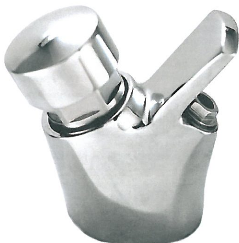
Obrázek 1 Stojánkové samouzavírací pítko