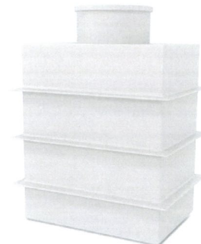
Obrázek 2 Vodoměrná šachta