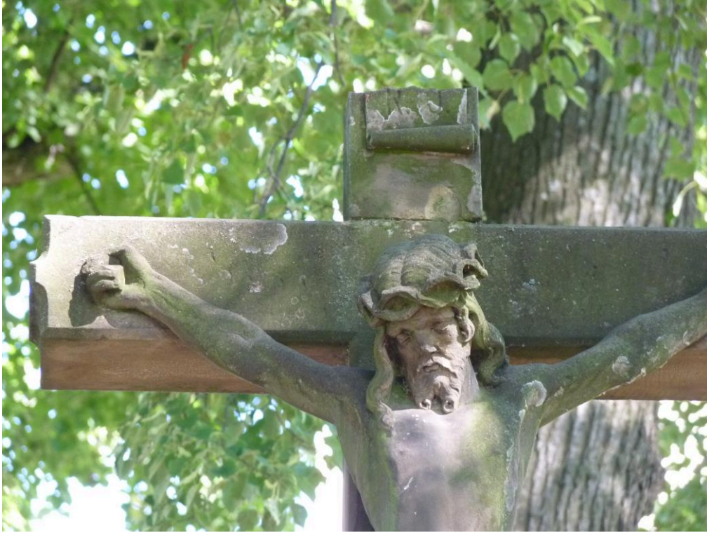
Chybějící část břevna kříže se štítkem I.N.R.I.