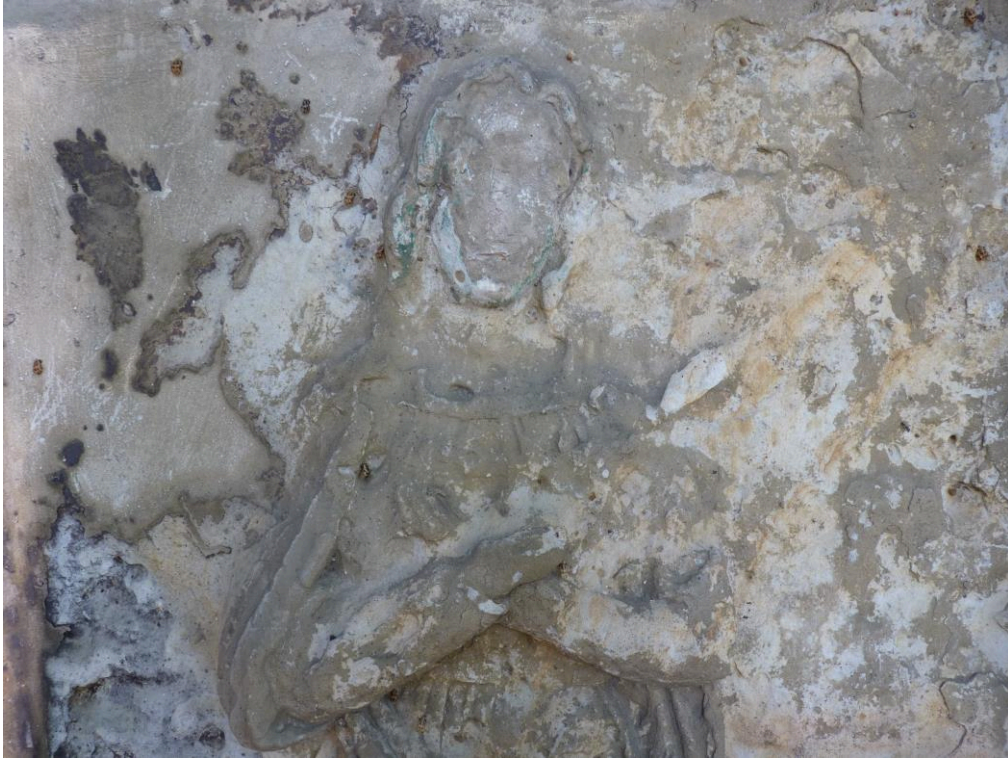
Zcela poškozený reliéf Panny Marie.