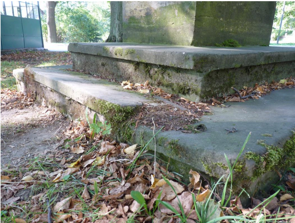
Spodní schodový stupeň je rozestoupený.