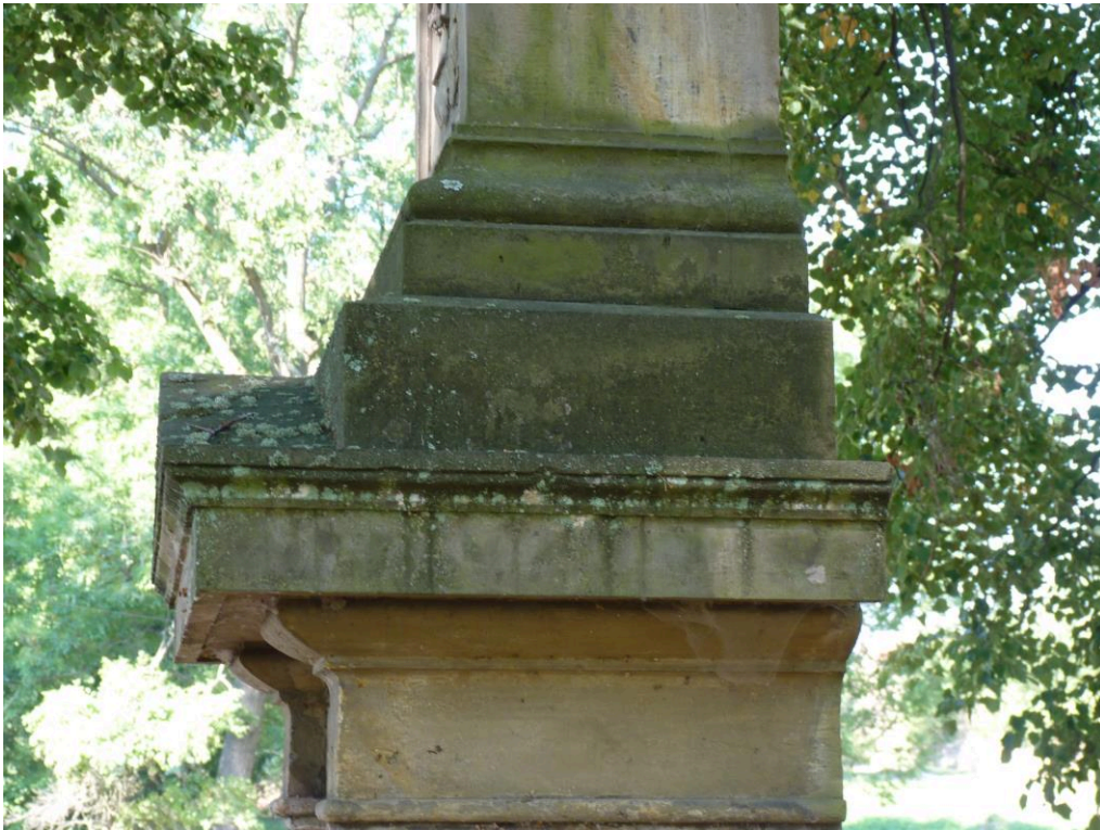
Detail biologického napadení.