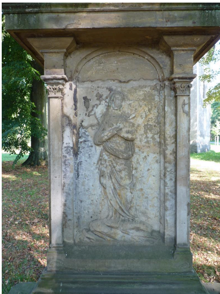
Poškozený reliéf Panny Marie.