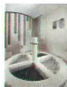
34 VOLAREZA Bedřichov Kneippův chodník