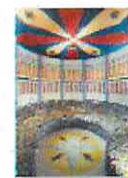
30 VOLAREZA Bedřichov parní solná sauna