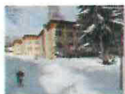
3 VOLAREZA Bedřichov - depondance zima