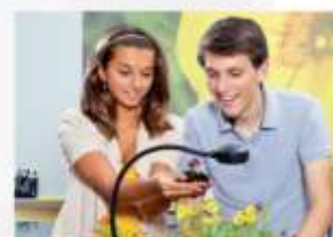
Projektory a vizualizéry