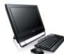
Výpočetní a kancelářská technika