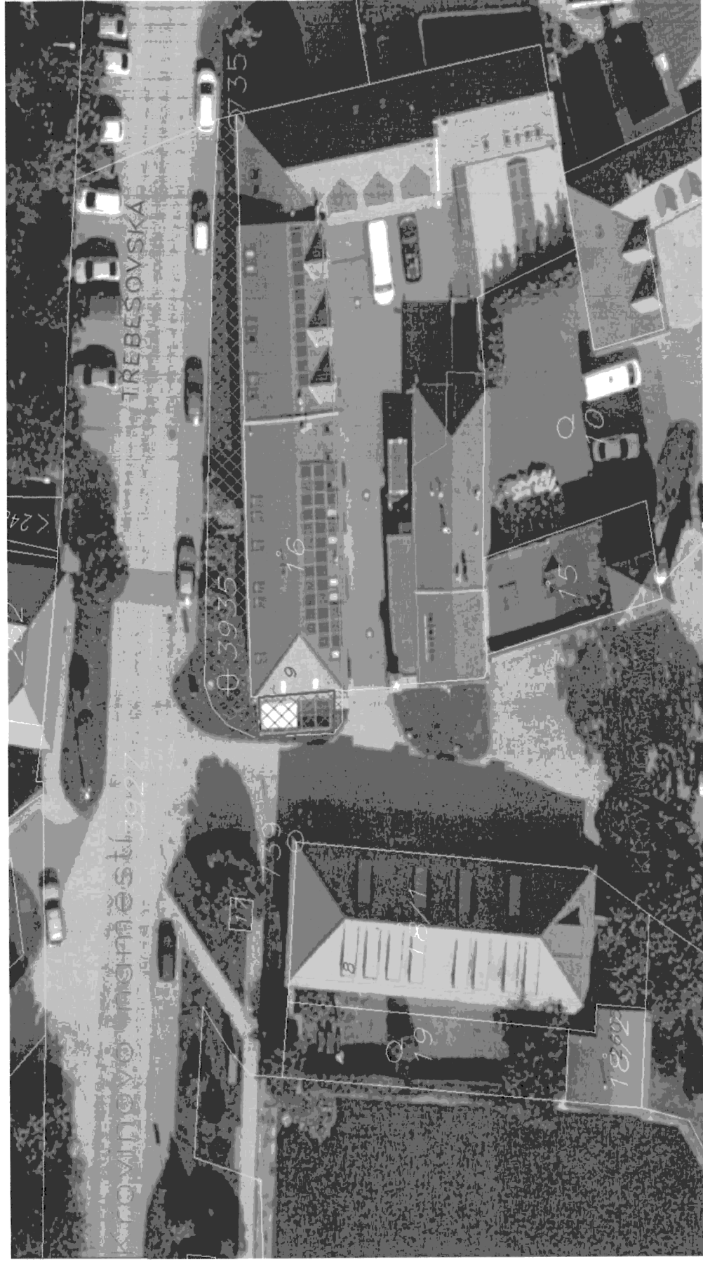
Ortofotomapa předmětu pronájmu – části pozemku KN parc. č. 3935 o výměře cca 26 m 2 v k. ú. Horní Počernice, obec Praha