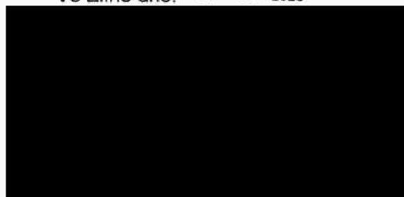
Akademie karate Zlín, z.s.