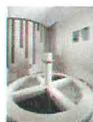
34 VOLAREZA Bedřichov Kneippův chodník