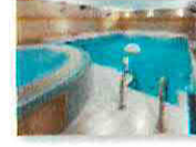
24 VOLAREZA Bedřichov Vodní ráj