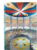
30 VOLAREZA Bedřichov parní solná sauna