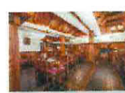
20 VOLAREZA Bedřichov - U Medvěda interier