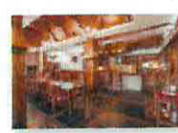
21 VOLAREZA Bedřichov - U Medvěda interier