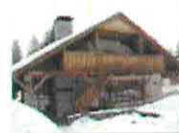
19 VOLAREZA Bedřichov - restaurace U Medvěda