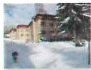
3 VOLAREZA Bedřichov - depandance zima