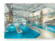
23 VOLAREZA Bedřichov Vodní ráj