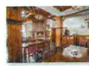
22 VOLAREZA Bedřichov - U Medvěda interier